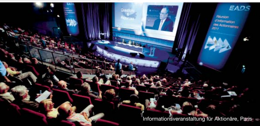
Informationsveranstaltung für Aktionäre, Paris

Die Konzernleitung hat dieses Jahr aktiv den Dialog mit Privataktionären gesucht: zuerst im Rahmen der Hauptversammlung (HV) in Amsterdam, dann bei ergänzenden Aktionärstreffen in Paris und München.