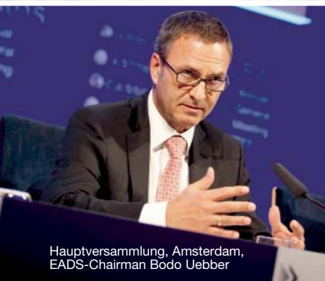
Hauptversammlung, Amsterdam, EADS-Chairman Bodo Uebber