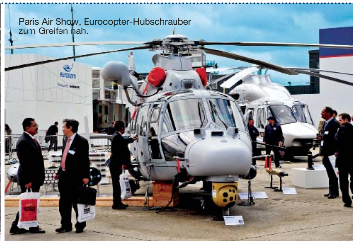
Paris Air Show, Eurocopter-Hubschrauber zum Greifen nah.