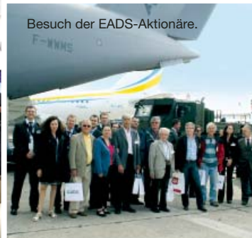
Besuch der EADS-Aktionäre.