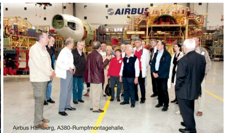
Airbus Hamburg, A380-Rumpfmontagehalle.