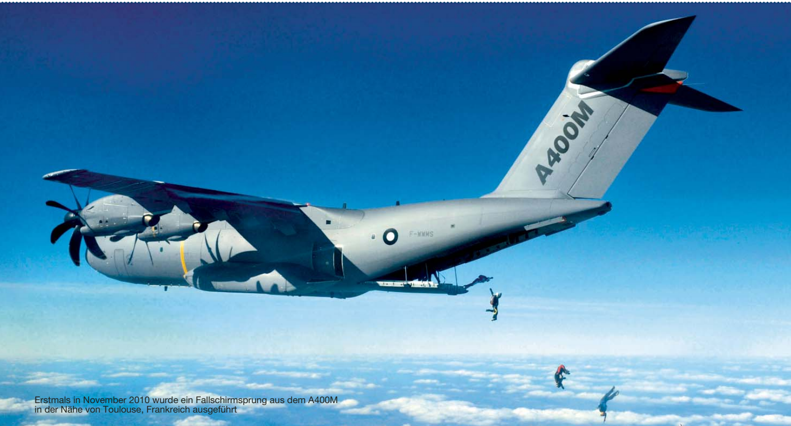
Erstmals in November 2010 wurde ein Fallschirmsprung aus dem A400M in der Nähe von Toulouse, Frankreich ausgeführt