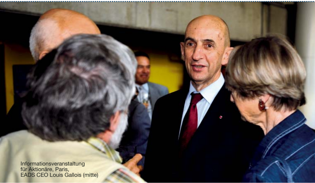
Informationsveranstaltung für Aktionäre, Paris, EADS CEO Louis Gallois (mitte)