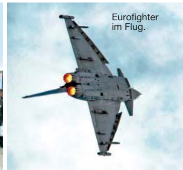
Eurofighter im Flug.