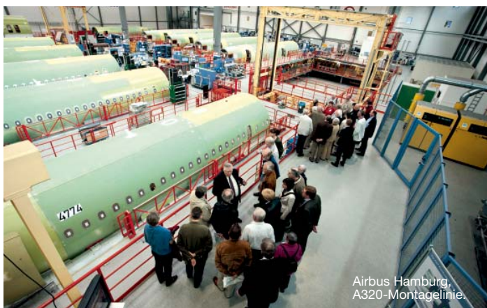
Airbus Hamburg, A320-Montagelinie.

durch das Airbus-Werk Hamburg-Finkenwerder teilnahmen. Dort besichtigten sie die A320-Montagelinie, wo die fertigen Baugruppen der Maschinen zusammengesetzt und gemäß den Kundenwünschen ausgestattet werden. Der Besuch der A380-Rumpfmontagehalle lieferte einen weiteren Höhepunkt.