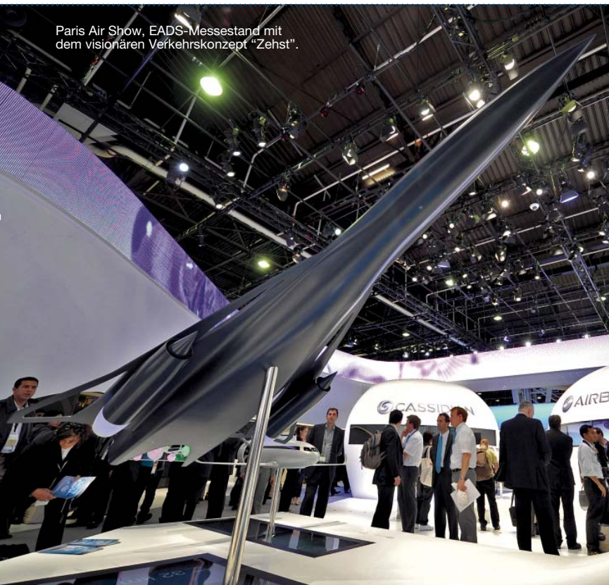
Paris Air Show, EADS-Messestand mit dem visionären Verkehrskonzept "Zehst".